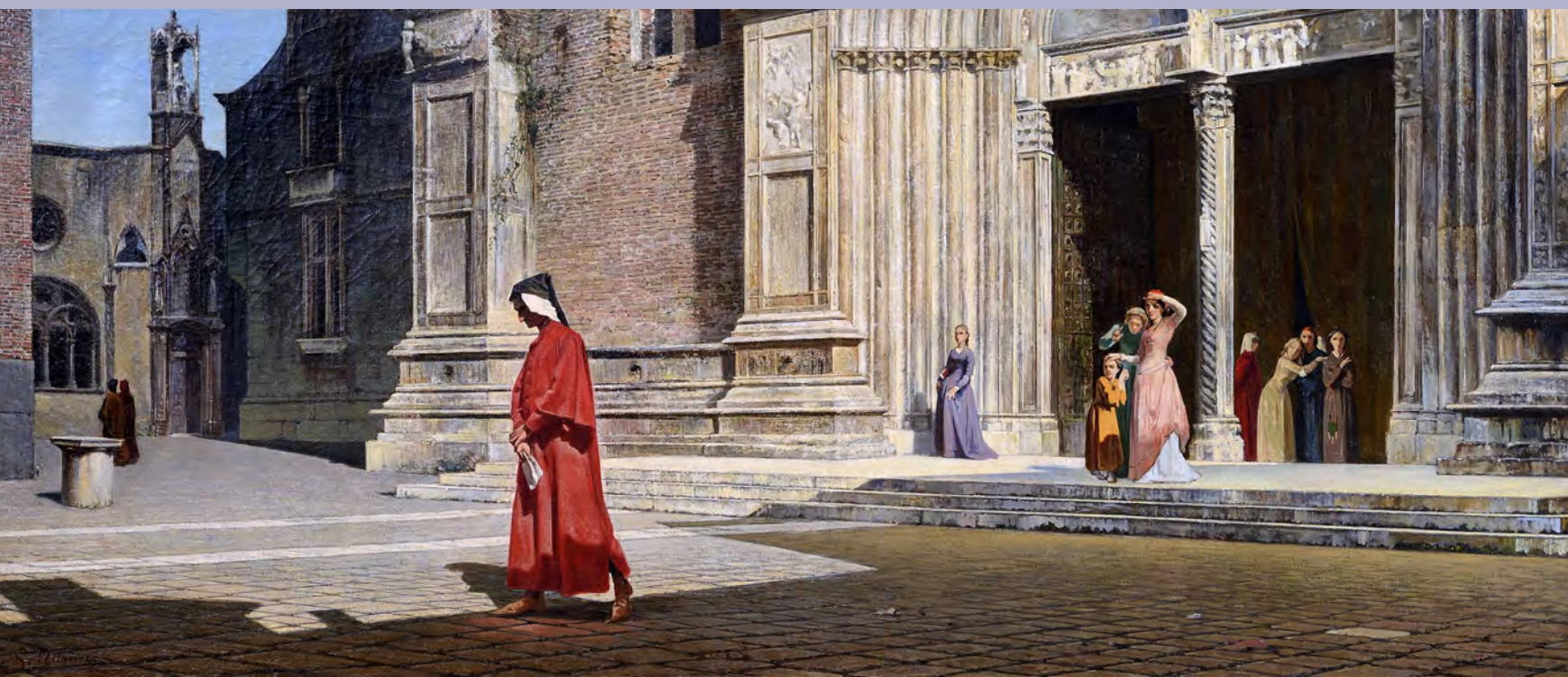
Francesco Saverio Altamura, Ecco colui che andò all'Inferno e tornò , olio su tela. Pescara, Collezione Venceslao Di Persio