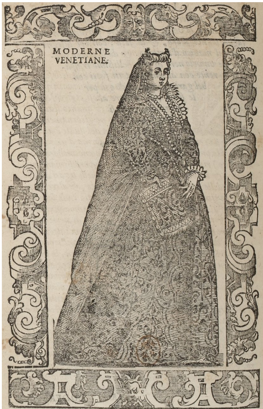
Fig. 1 - Moderne venetiane . C. Vecellio, De gli habiti antichi et moderni , 1590.