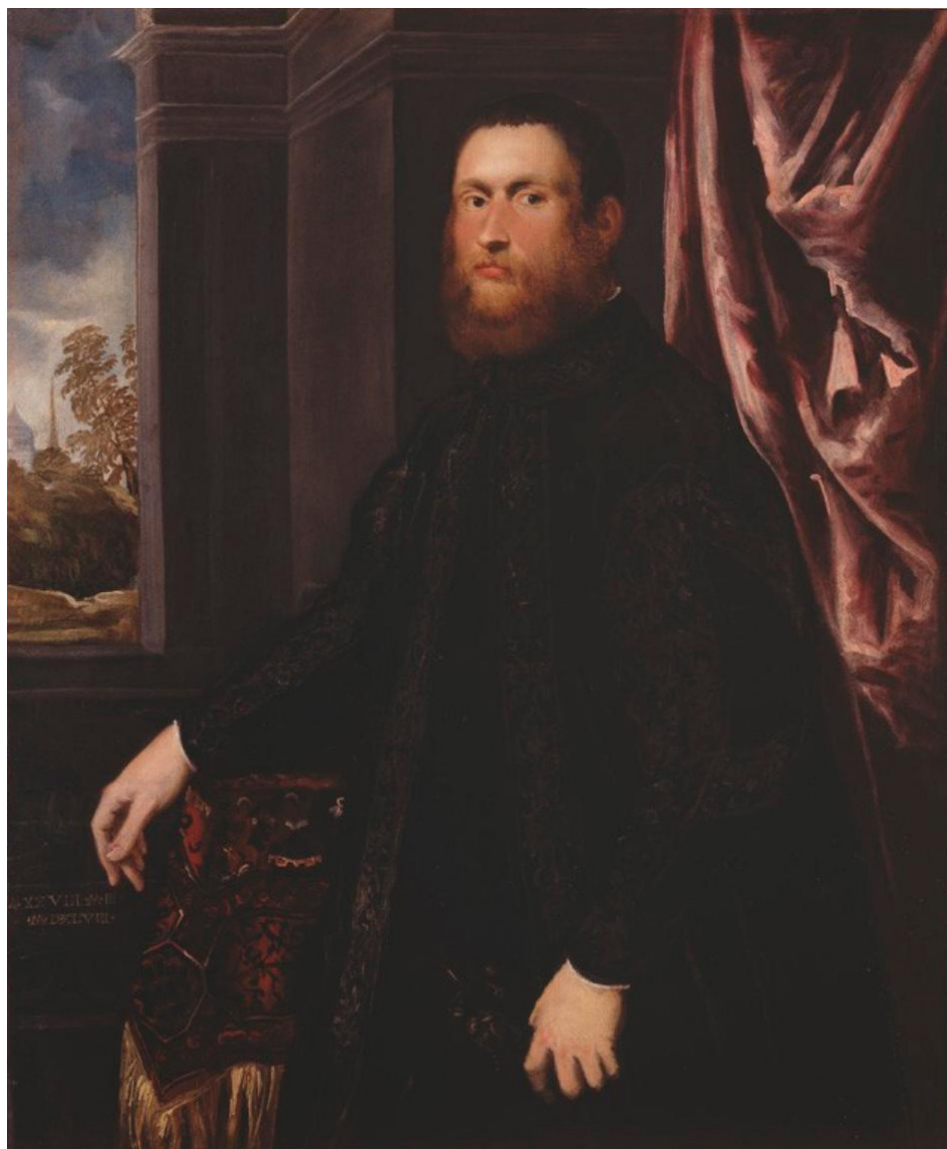
Fig. 4 - J. Tintoretto, Ritratto di uomo , Staatsgalerie, Stoccarda, 1548.