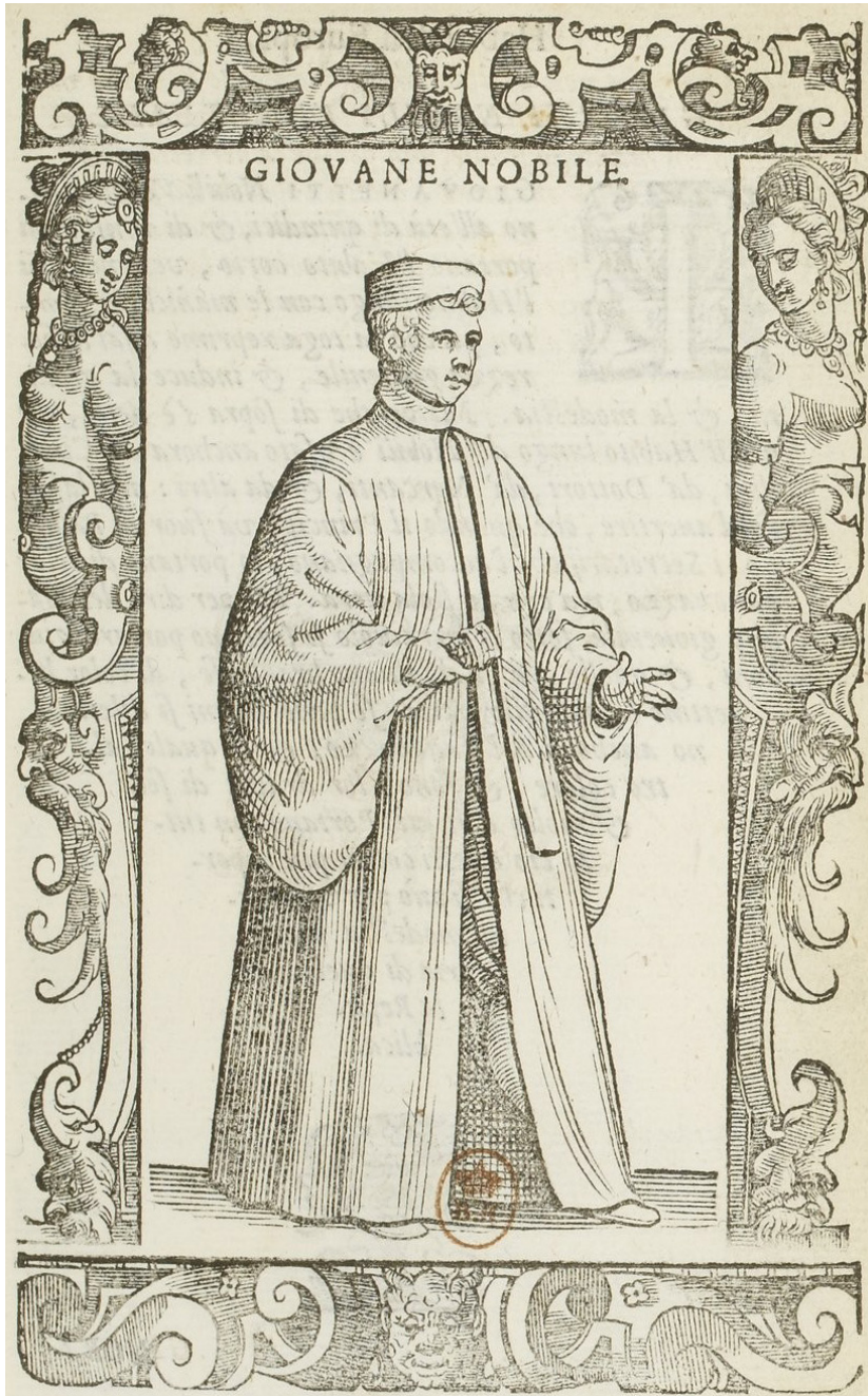
Fig. 3 - Giovane nobile . C. Vecellio, De gli habiti antichi et moderni , 1590.