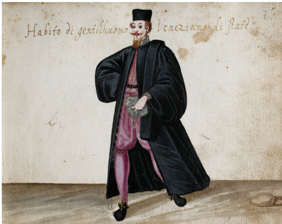
Fig. 5 - Habito di gentiluomo Veneziano di state , Padova, Biblioteca del Museo Bottacin, Codicetto Bottacin , ms. M.B. 970, c. 7.

le costose e pregiate vesti romane e alla ducale che abbondano nei guardaroba dei patrizi, se vengono sottratte alla staticità di fonti quali libri di conti e inventari, possono essere un prisma assai interessante per esplo-