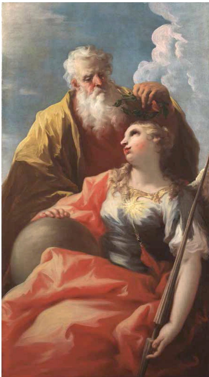
Fig. 1 – Giovanni Antonio Pellegrini, La Virtù incoronata dal Merito , collezione privata.

si alza sopra il senso comune; ha il sole nel petto perché, come l'astro illumina la terra, ella dal cuore dà vigore e scalda tutto il corpo dell'uomo. Regge l'asta perché alla Virtù è riconosciuto il governo, la