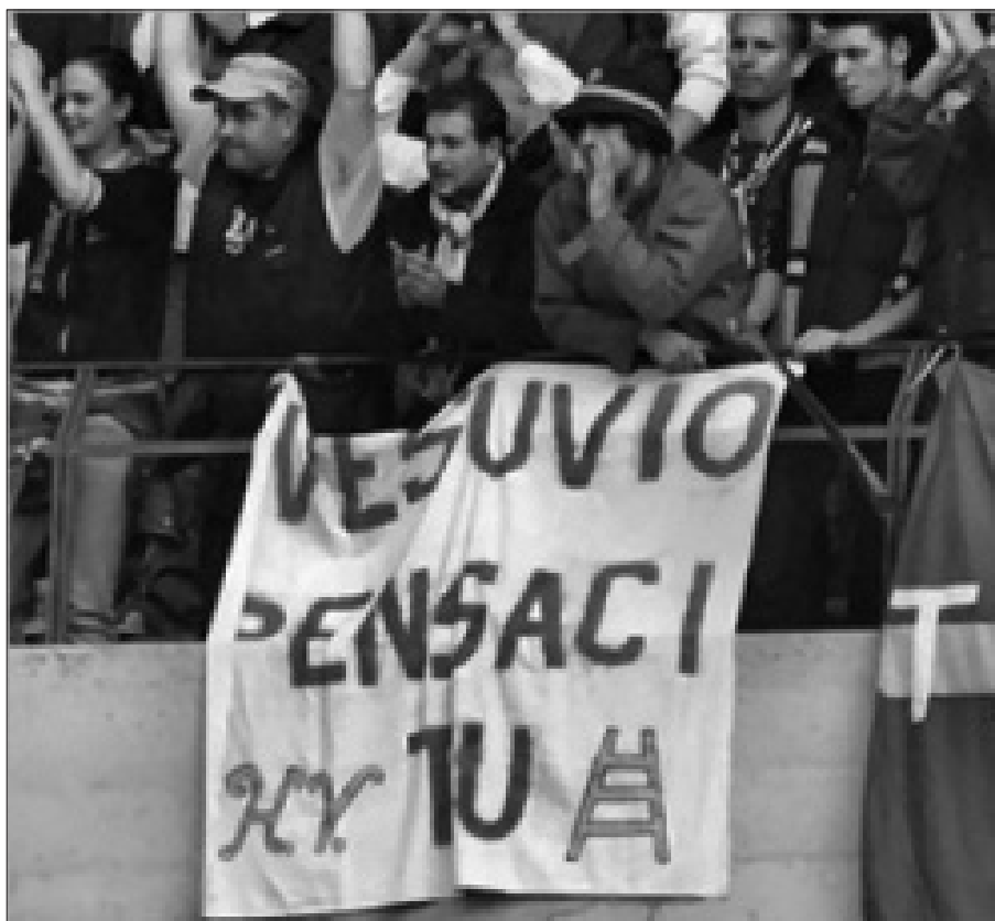
Fig. 2 – Gli ultras veronesi e i loro striscioni offensivi verso le squadre avversarie.

La violenza della piazza politica «ha pescato» e continua a «pescare» fra questi guerriglieri da stadio. Il modo così irrazionale ed antirazionale di affrontare e di vivere il momento dello spettacolo sportivo, gli entusiasmi, le rabbie, le illusioni, le sfide, le contrapposizioni, i rancori gli sfoghi, le passioni, le frustrazioni e le allucinazioni che accompagnano il fanatismo sportivo sconcertano tutti coloro che, disertori o comunque non frequentatori degli stadi, guardano con diffidenza, distacco, stupore ed angoscia la realtà della «droga» calcistica. Le interviste che riportano i quotidiani realizzate a molti gruppi ultras risultano inquietanti e preoccupanti, soprattutto se paragonate all'immagine tradizionale dello stadio come moderna piazza dove ritrovarsi per trascorrere qualche ora assieme assistendo alla partita di calcio della propria squadra del cuore (fig. 2).