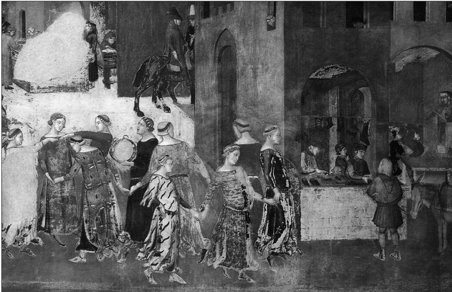
Fig. 5 – Ambrogio Lorenzetti, “Effetti del Buon Governo in città”. Particolare delle giovani fanciulle che danzano in piazza. Siena, Palazzo Pubblico, Sala della Pace.

co a sociologi e urbanisti, descrive lo sparpagliamento in molti agglomerati urbani (Nancy, 2002, p. 21)». E la piazza, tradizionale – discoteca – stadio – virtuale che sia, può e deve svolgere il suo ruolo di centro delle comunicazioni (fig. 5). Gli stadi di calcio, nuove arene che, come i circhi e gli anfiteatri nell'antichità classica, sono oggi i luoghi urbani deputati ad ospitare gli spettacoli sportivi e le manifestazioni di massa devono diventare spazi che vivono di relazioni. Consapevoli che la città è, più di ogni altro «un sistema di organizzazione connessa in rete nel quale ogni parte influisce sul tutto, anzi un sistema di organizzazione dinamica in rete che si modifica nello spazio e nel tempo (Cramer, 1999, p. 53)» proprio la piazza può fornire una forma alla città, provvisorio ordine in costante movimento caotico, ma anche tessuto di relazioni sempre in bilico, creazione di ordini spontanei in perenne adattamento, socialità consapevole che si mescola con un substrato quasi biologico.