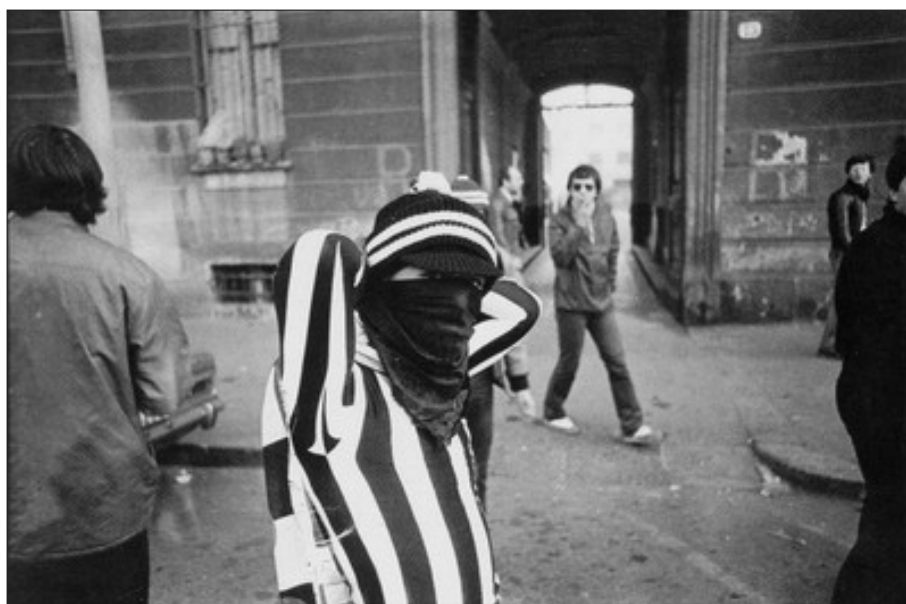
Fig. 1 – Immagine tratta dal libro “Ragazzi di Stadio”.

Non fosse che tutti gli scatti di Segre sono in bianco e nero e che alcuni capi di abbigliamento sono fuori moda, «Ragazzi di stadio» potrebbe essere fresco di stampa: saluti romani, scritte e striscioni violenti, e anche un volantino con la parola d'ordine nazista «Gott Mit Uns». Infatti, le differenze tra le tifoserie di oggi e quelle di ieri, a cercarle, sono altre (fig. 1). Chi conosce Segre sa bene quanto i suoi lavori siano «socialmente impegnati», preoccupati di scavare e scovare quelle parti di quotidianità in ombra, dimenticate o comunque poco considerate dai grandi media. Gli ultras erano, in quegli anni, degli «sconosciuti» a tutti gli effetti, rappresentavano una realtà ancora in via di radicamento che, agli occhi dell'opinione pubblica, assumeva visibilità e attirava attenzione solo al verificarsi di atti di violenza e teppismo.