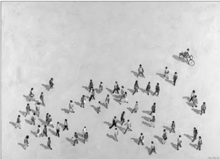
Fig. 4 – Dalla piazza tradizionale alla piazza virtuale: verso l'affermazione di uno spazio pubblico ( www.sonoioche.blogspot.com ).

Si parla oggi anche di «piazza» telematica, non quindi di un luogo fisico ma di uno spazio virtuale. Non più delimitata in senso materiale, architettonico, la piazza telematica, luogo delle promesse, degli appuntamenti, dei dibattiti di diversa natura, dei mercati può essere definita realtà d'apparenza: lo spazio telematico è, infatti, altro dalla realtà fisica. Occorre però fare attenzione: anche la piazza telematica ha una sua realtà, essa, infatti, è tutt'altro che apparente; a differenza delle piazze di cemento certamente essa è una realtà concettualizzata nella quale le situazioni sono plasmate in modo simbolico, ma ciò non vuol dire che in essa non si definiscano atti concreti. L'acquisto di beni, ad esempio, che si realizza grazie alla rete, ne è un chiaro manifesto. E a questo proposito si può osservare che la piazza telematica non solo permette la comunicazione ma va oltre, crea spazi di comunicazione (fig. 4).