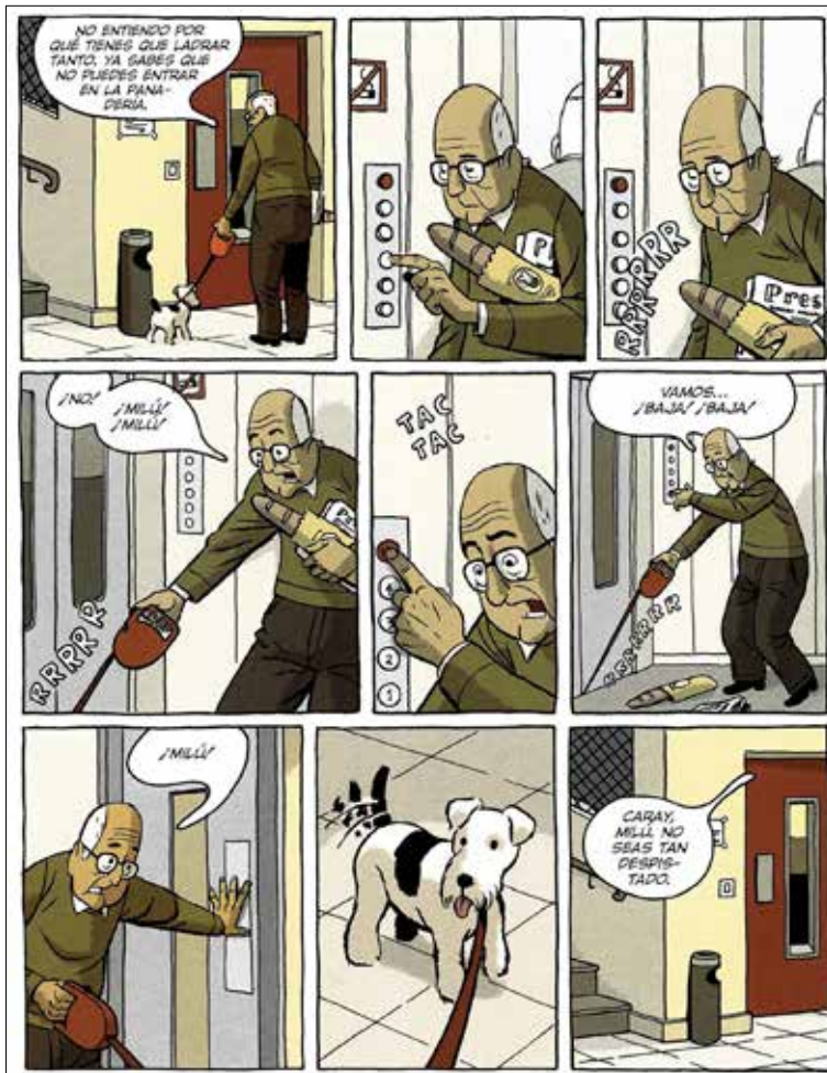
Figura 4. Paco Roca, Arrugas , 2008 (p. 100). Rides di Paco Roca © Editions Delcourt, France, 2007. L'edizione in spagnolo è stata pubblicata da Astiberri Ediciones

tivo, sono sconfortanti in quanto testimoniano il fallimento del linguaggio e di ogni narrazione di fronte all'alzheimer. Da una parte consola ammettere che il linguaggio non possa dare voce ad ogni cosa o debba capitolare dinanzi alla via crucis dell'ammalato di alzheimer, dall'altra parte questo suo tacere e piegarsi alla sofferenza muta dà un senso di sollievo perché rende tutto più umano. Così umano, troppo umano, che il lettore dopo le due pagine bianche, incontra, ad annunciare infinite altre vicende, alcune strisce con uno sbadato e distratto anziano accompagnato da un cane, a testimoniare che la solitudine, la mancanza di affetti, la malattia, riguardano molti altri anziani, oltre a Emilio, Miguel, Modesto, Sol, Rosario, Carmencita, Juan: