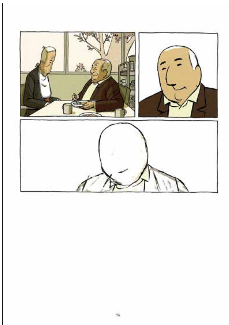
Figura 3. Paco Roca, Arrugas , 2008 (p. 96). Rides di Paco Roca © Editions Delcourt, France, 2007. L'edizione in spagnolo è stata pubblicata da Astiberri Ediciones

Alla fine si vedono soltanto i contorni delle figure e degli oggetti e tutto si dissolve e si disperde, striscia dopo striscia, fino a lasciare nelle mani del lettore due pagine completamente bianche, significativamente bianche (Roca 2008, pp. 98-99).