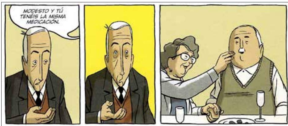
Figura 1. Paco Roca, Arrugas, 2008 (p. 55). Rides di Paco Roca L'edizione in spagnolo è stata pubblicata da Astiberri Ediciones

La forza del disegno di Paco Roca sta nell'introdurre il lettore nell'universo privato nel quale vivono gli anziani, raccontando pensieri e sensazioni dell'ammalato di alzheimer che il mondo esterno non percepisce. In tal senso è straordinaria nella sua drammaticità la vignetta che illustra quando Emilio si rende conto di soffrire di alzheimer e che il futuro che lo attende è quello di Modesto. Infatti il momento più duro è quando ci si rende conto di avere l'alzheimer. Paco Roca lo fa con un vignetta, l'unica di tutta la novela gráfica nella quale predominano i toni pastello: