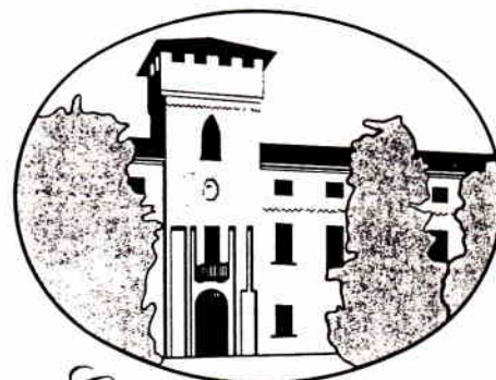
Castello di Suno

situazione di benessere, fuori da una logica di target. Il castello, situato nel centro del paese di Suno, tra Novara e Borgomanero, a ridosso del Lago Maggiore, comprende 70 unità di abitazione, costituite da appartamenti o da came-