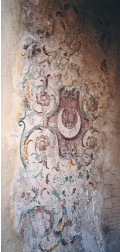
Fig. 2 - Mantova, Palazzo Ducale. Impresa del «Sic» affrescata sullo stipite destro della porta che conduce dalla Sala delle Teste in Corte Nuova al balconcino sul cortile retrostante la basilica palatina di Santa Barbara.