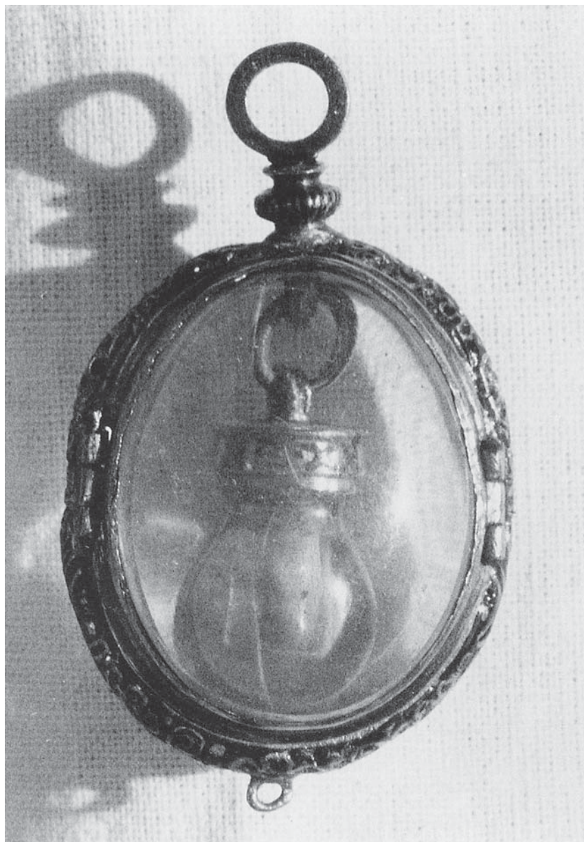
Fig. 1 - Medaglione-Reliquiario del Preziosissimo Sangue. Fine secolo XVI. Mantova, Curia Diocesana. Da: M. G. GRASSI, I medaglioni reliquiario di Vincenzo I Gonzaga , «Civiltà Mantovana», n.s., n. 21 (settembre 1988), pp. 1-38.