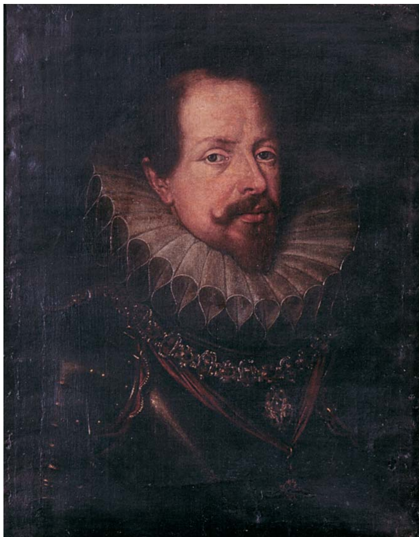
Fig. 4 - Frans Pourbus (attr.), Vincenzo I Gonzaga (1608-09). Olio su tela (cm 70 x 56). Mantova, collezione privata.