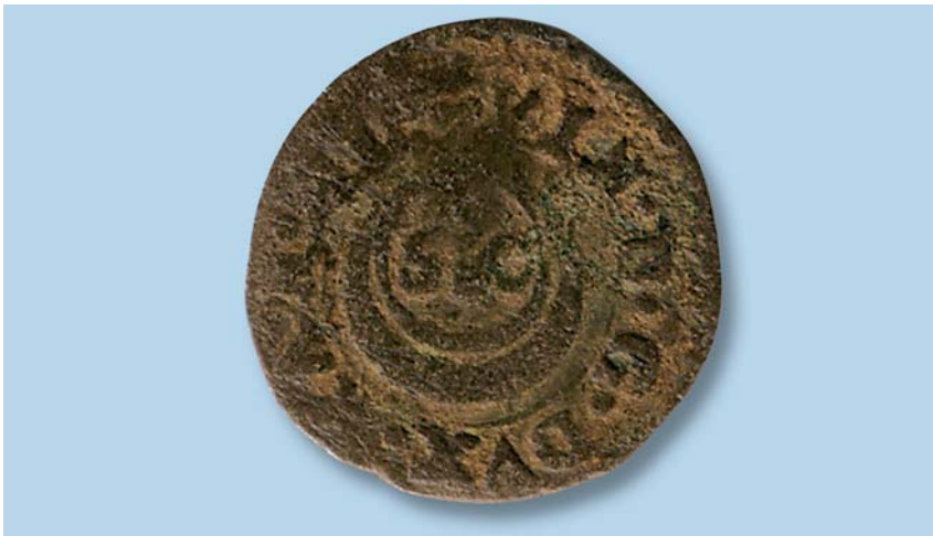
Fig. 3 - Impresa del «Sic» su un Quattrino di Vincenzo Gonzaga del 1595 (Magnaguti 480; Mantova, collezione privata).