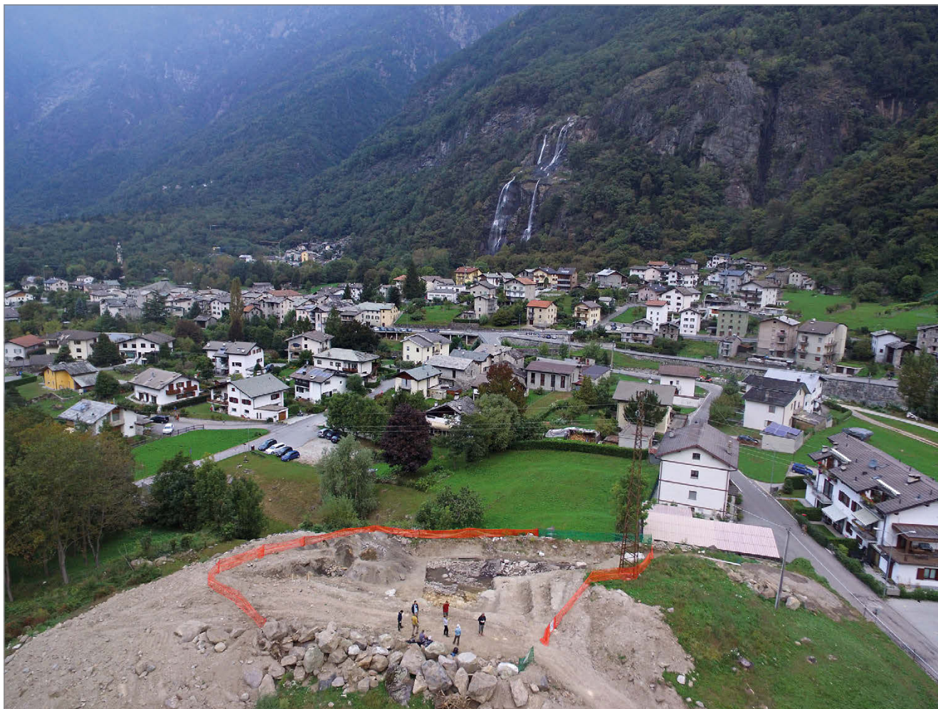
fig. 2. Area di Mot del Castel, sullo sfondo le Cascate dell'Acquafraggia.