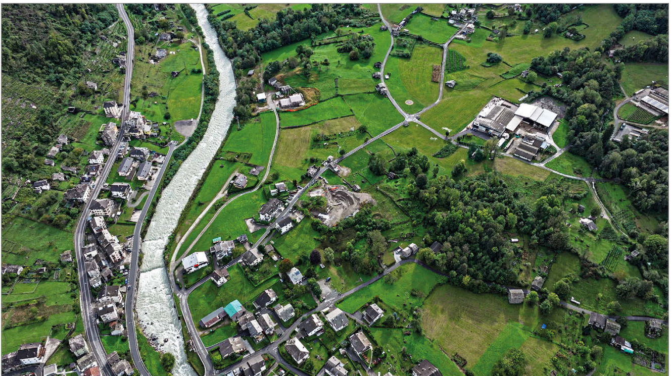
fig. 1. Area di Mot del Castel, vista dall'alto.