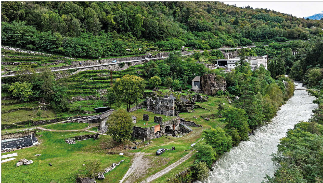
fig. 3. Palazzo Belfort.