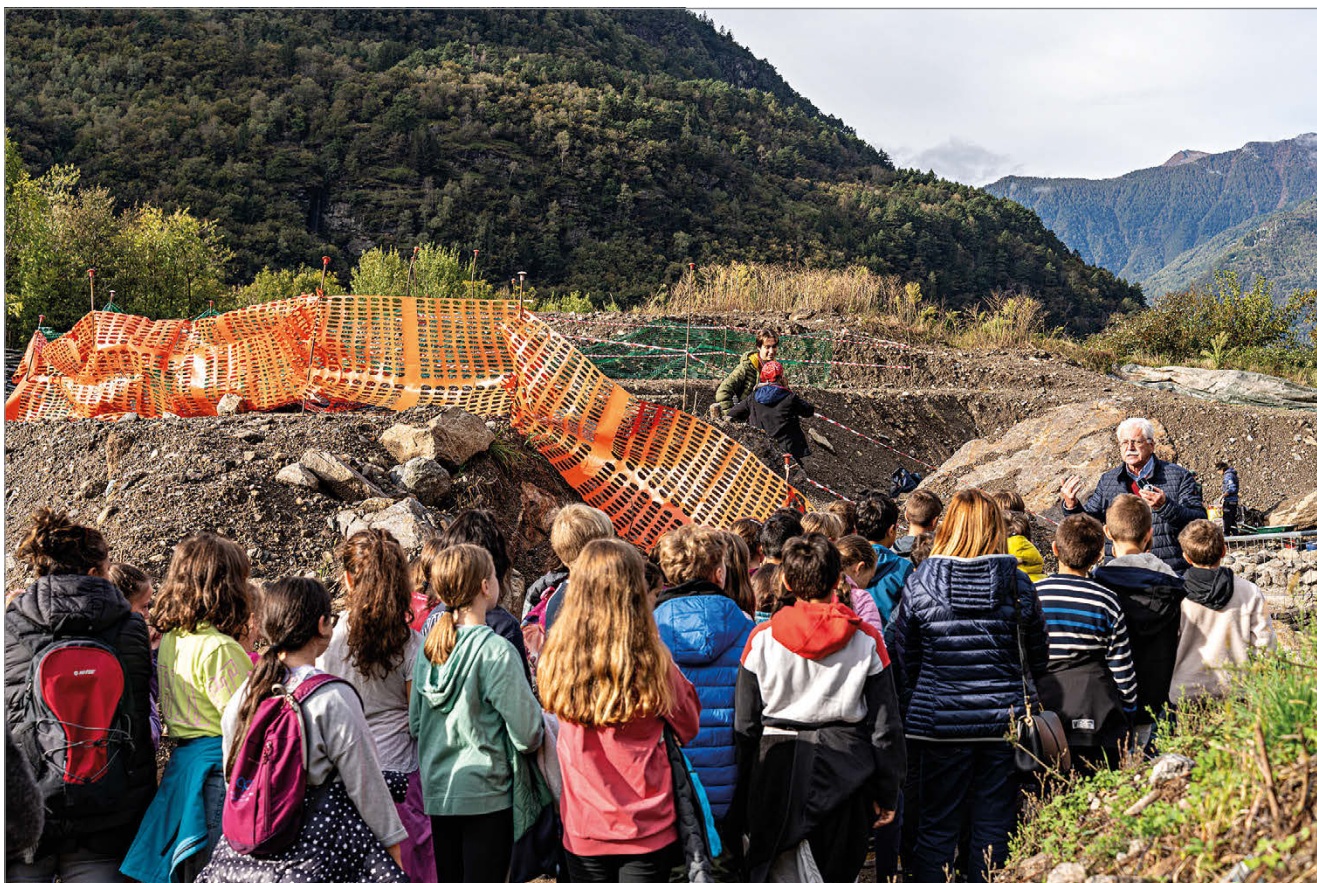
fig. 5. Visita delle scuole presso lo scavo di Mot del Castel.