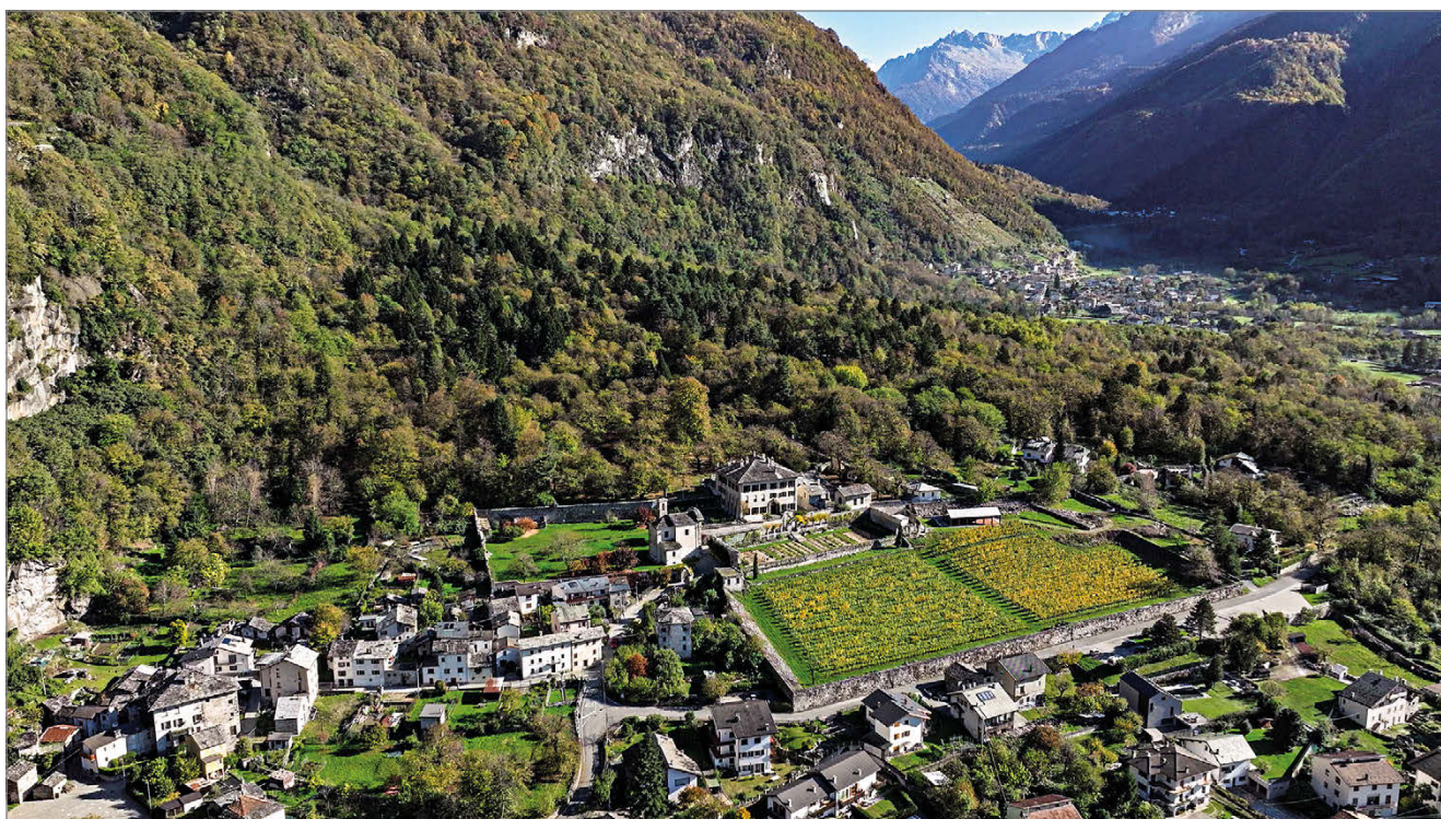
fig. 3. Palazzo Vertemate Franchi.