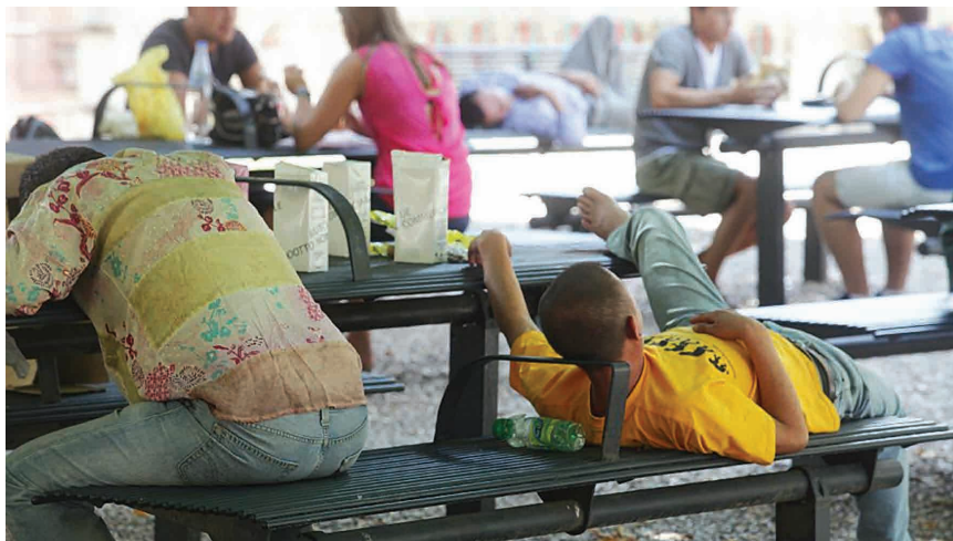
Piazza Indipendenza. http://www.larena.it/image/policy:1.2447314:1438863842