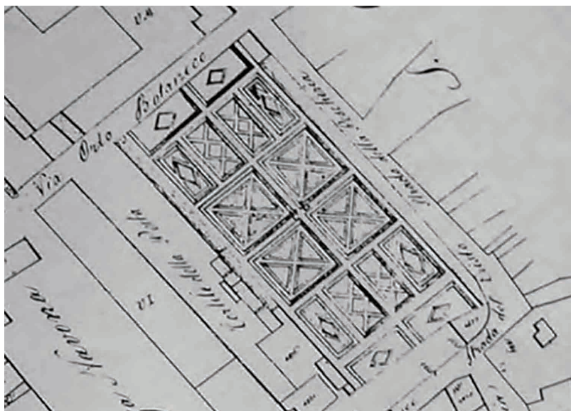
L'area dell'Orto Botanico nel Catasto Napoleonico del 1817.

circostante, nonché l'edificato che nel tempo era sorto fuori delle mura di Verona" (LODI, VARANINI, 2014). Proprio in questa cartografia sono ben riconoscibili quelle che saranno poi piazza Indipendenza, piazza Viviani e piazza Navona, nell'estensione dell'ampio spazio verde e nella consistenza degli edifici e delle mura che lo circondano, frutto della realizzazione del progetto di Cansignorio che nel 1364 operò un vero e proprio sconvolgimento urbano, che ebbe come conseguenza la demolizione di una contrada e l'occupazione permanente di una vasta superficie cittadina (le attuali piazza Indipendenza e piazza Viviani, via Nizza e via Cappello) per sistemare le dimore signorili di Alberto della Scala. Dietro quelle case, a sud del palazzo grande, vi era fino ad allora un vasto brolo circondato da edifici, che in quell'occasione venne ampliato e trasformato in giardino con vasche e fontane, protetto dall'ingerenza pubblica grazie ad un alto muro. Se, come mostra la mappa del Filosi del 1737, la situazione dell'area si mantiene praticamente inalterata per tutta l'età veneziana, alla caduta della Repubblica, l'Orto del Capitano viene dato nel 1801 in proprietà all'Accademia di Agricoltura Commercio e Arti di Verona che lo