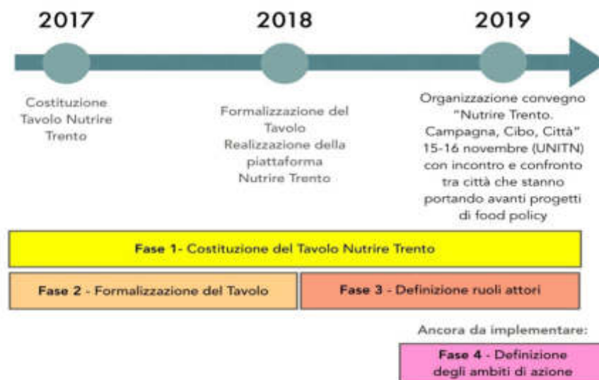
Figura 3. Costituzione e implementazione della Food Policy a Trento.

Sebbene in alcuni momenti molto faticoso, a causa dei tempi lunghi non sempre coincidenti con le aspettative degli attori coinvolti, questo percorso ha garantito sin dall'inizio la partecipazione dei soggetti più rappresentativi del sistema locale del cibo e comprendenti sia le nuove organizzazioni dei consumatori (GAS, Slow Food) sia le organizzazioni dei produttori, sia quelle con una storia più antica e radicata (Coldiretti, Confagricoltura, CIA), sia nuove reti di produttori o di bio-distretti. In entrambi i contesti si è notato come l'aver lasciato il processo sempre aperto abbia facilitato l'aggregazione nel tempo di altri soggetti e organizzazioni territoriali, seguendo una dinamica spontanea basta spesso sul semplice passaparola.