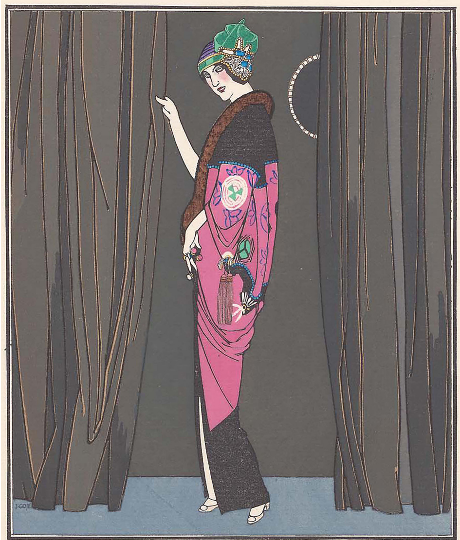
A LA COMÉDIE Manteau de Théâtre, par Paquin