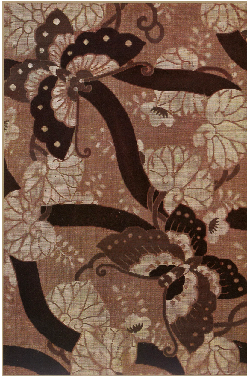
Fig. 5 - M. Pillard Verneuil, Étoffes japonaises tissées et brochées. Quarante-vingts planches précédées d'une préface de G. Migeon , Paris, Librairie Centrale des Beaux-Arts, ca. 1910, tav. 1, Papillons et feuilles d'ornement .