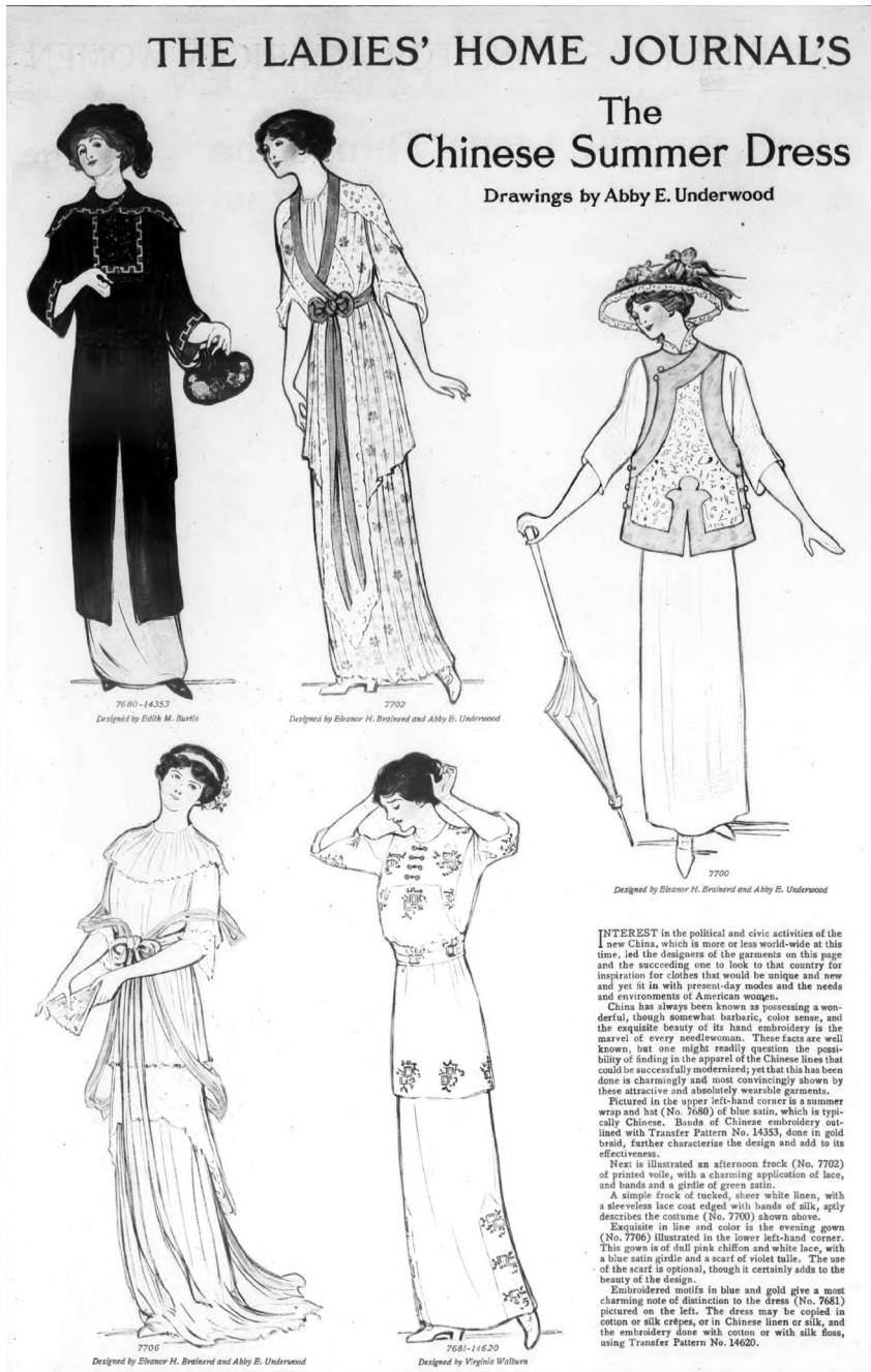
Fig. 3 - Figurini con abiti di ispirazione cinese, «Ladies' Home Journal», 1913.