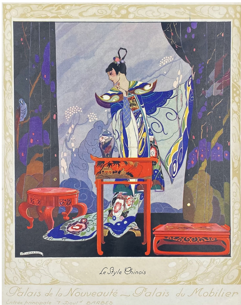
Fig. 4 - U. Brunelleschi, Le style chinois . L'Ameublement au Palais de la Nouveauté, Palais du Mobilier, Parigi, Grands Magasins Dufayel, 1923.