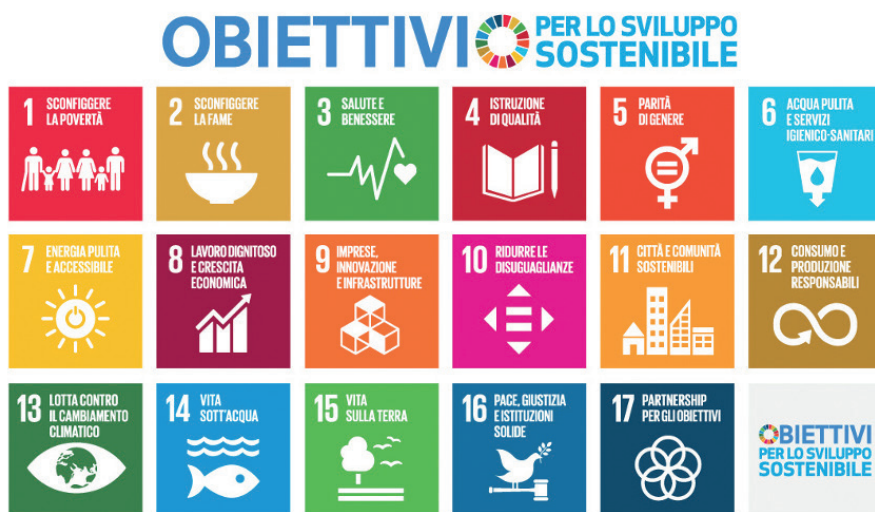
Figura 1. Obiettivi per lo sviluppo sostenibile (Organizzazione delle Nazioni Unite, 2015) (tratto da: unric.org/it/agenda-2030 ).

Le esigenze di sostenibilità del pianeta impongono una riflessione sull'impatto degli stili di vita e sulla necessità di ripensarne di nuovi. Nel 2015 l'ONU ha stabilito un'agenda per il cambiamento, organizzata in diciassette Obiettivi per lo sviluppo sostenibile (OSS/SDGs, Sustainable Development Goals), da raggiungere entro il 2030 (Figura 1).