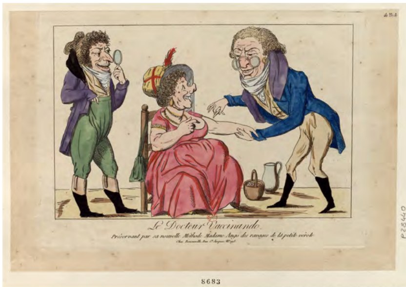
Fig. 12 - Le Docteur Vaccinando : Préservant par sa nouvelle Méthode Madame Ango des ravages de la petite vérole , Paris, chez Bonneville, [s.n.] ; [entre 1794 et 1799], https://gallica.bnf.fr/ark:/12148/btv1b6953794n