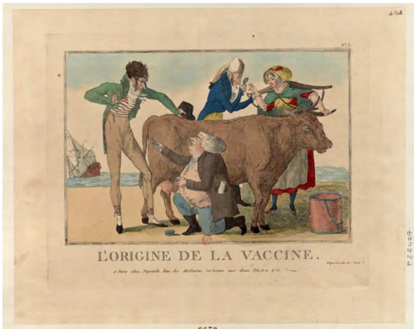
Fig. 10 - L'origine de la vaccine , estampe, Paris, chez Depeuille, [s.n.] ; [s.d.], https://gallica.bnf.fr/ark:/12148/btv1b6953783v