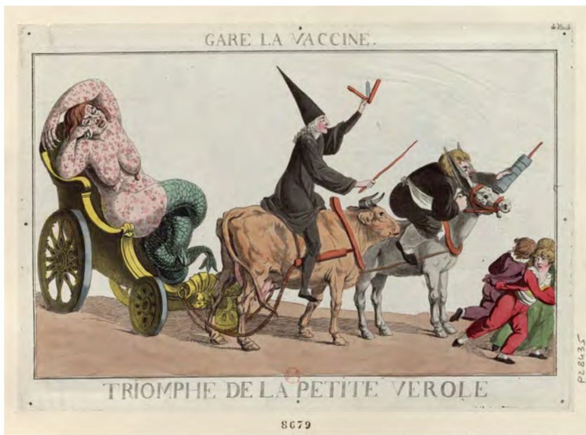
Fig. 11 - Argaud de Barges, Gare la vaccine. Triomphe de la petite vérole , estampe, [S.l.] : [s.n.], [s.d.], https://gallica.bnf.fr/ark:/12148/btv1b69537900