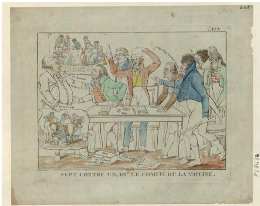
Fig. 9 - Sept contre un, ou le comité de la vaccine , estampe, [S.l.] : [s.n.], [s.d.], chez Depeuille, https://gallica.bnf.fr/ark:/12148/btv1b6953792t