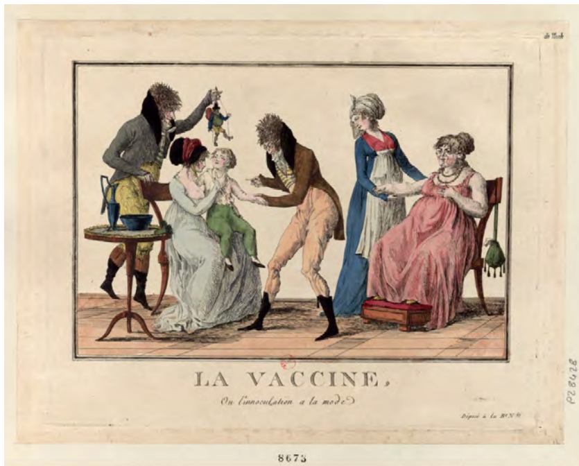
Fig. 5 - La vaccine, ou l'innoculation à la mode , Paris, chez Depeuille, [s.n.] ; [s.d.], https://gallica.bnf.fr/ark:/12148/btv1b6953785p