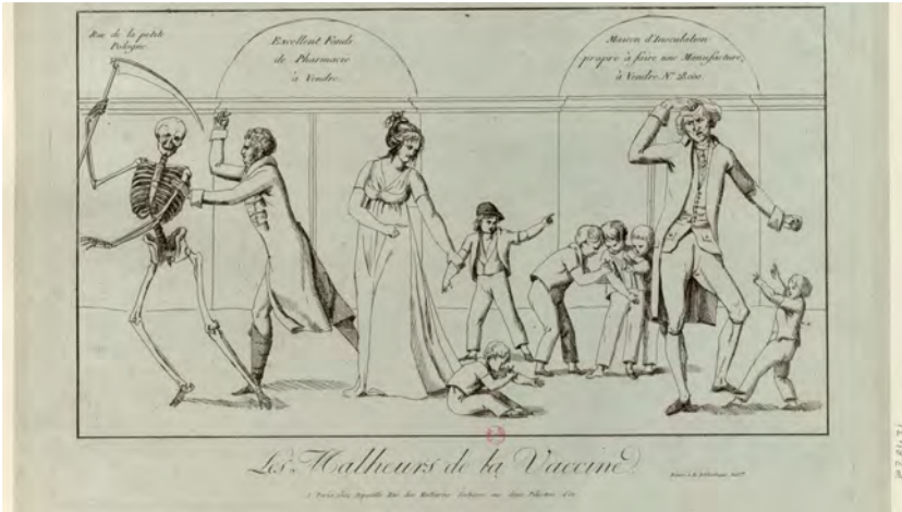
Fig. 4a - Les Malheurs de la vaccine , Paris, chez Depeuille, [s.n.] ; [s.d.], https://gallica.bnf.fr/ark:/12148/btv1b69537863