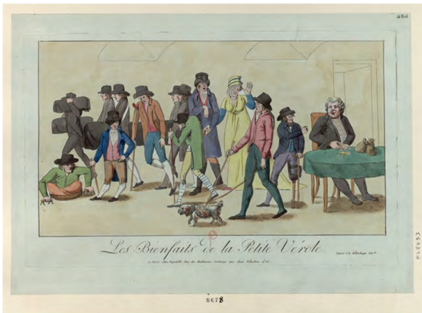
Fig. 3 - Les bienfaits de la petite vérole , [s.l.] ; [s.n.] ; [179.], https://gallica.bnf.fr/ark:/12148/btv1b6953789b