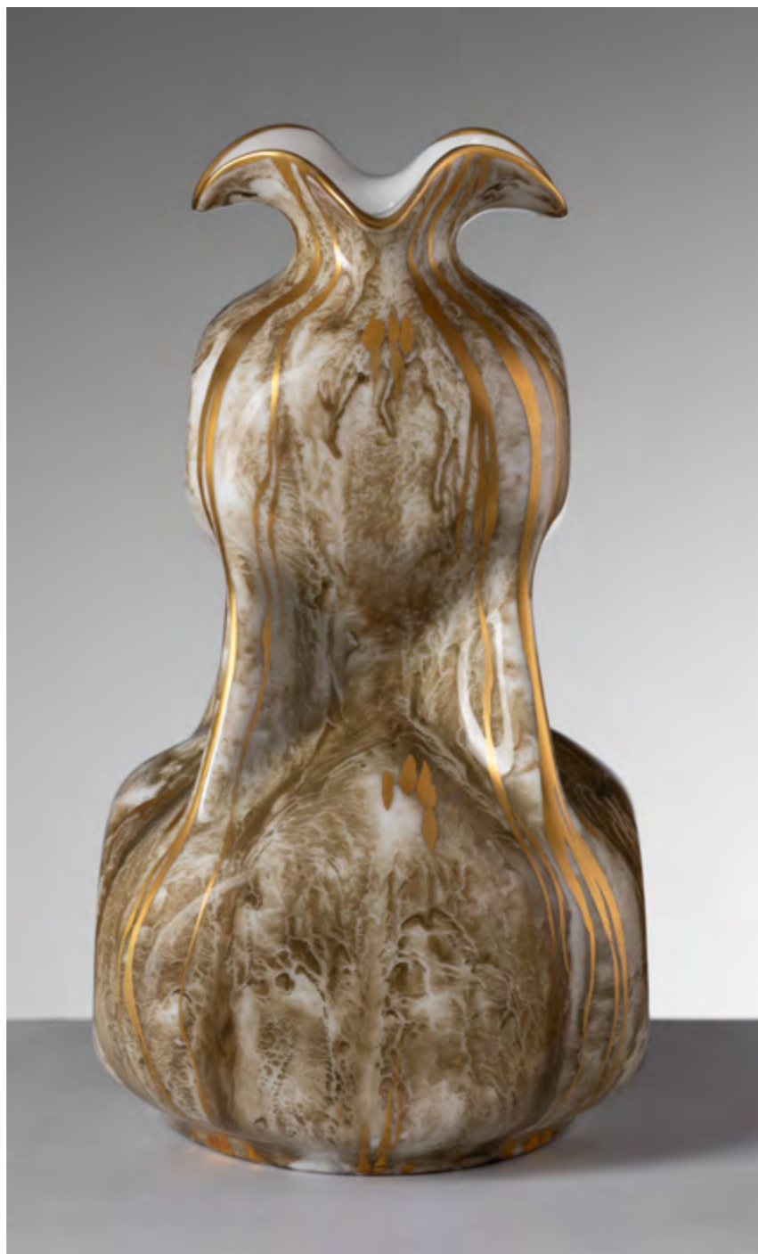
Fig. 2 Società Ceramica Richard-Ginori, Vaso a doppio rigonfiamento con decoro verde a lava dorata , 1898 circa, porcellana, Sesto Fiorentino, Museo Ginori

simbolista e delle reminiscenze botticelliane, i due vasi gemelli della Ginori, con il medesimo corpo sferico dotato di anse a serpe (mod. 479), dipinti il primo a grottesche, il secondo con medaglione istoriato, erano invece esempi perfetti della linea neorinascimentale, confermata anche dalle altre immagini a corredo dell'articolo, che mostravano un vaso dalle forme cinquecentesche con decorazioni a raffaellesca (mod. 488) e un candelabro con telamone di michelangiolesca memoria (mod. 617). Nel suo articolo, Ugo Matini