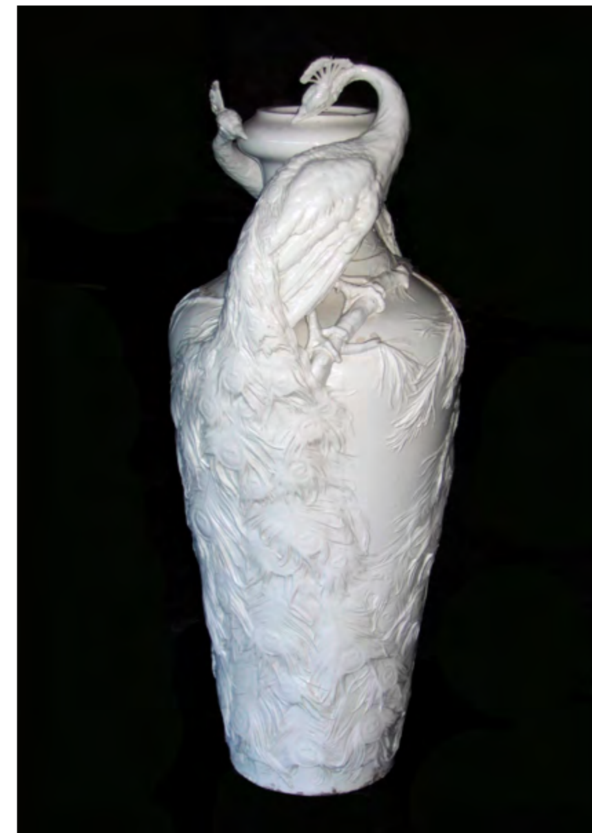
Fig. 5 Società Ceramica Richard-Ginori, Vaso con pavoni in rilievo , porcellana, 1902 circa, Sesto Fiorentino, Museo Ginori

Il terzo suggerimento che la Manifattura Ginori colse dal confronto con Sèvres fu la ripresa di una tecnica settecentesca, quella dell'ingobbio, che consentiva di ottenere delicati effetti a rilievo grazie alla sovrapposizione di sottili strati di argilla liquida. Partendo dall'analisi di un vaso a sei facce, decorato simmetricamente con penne di pavone su fondo chiaro, Buschetti fornì preziose informazioni di confronto tra la tecnica applicata in Francia e quella tentata nei laboratori di Doccia: "decorazioni analoghe sono state