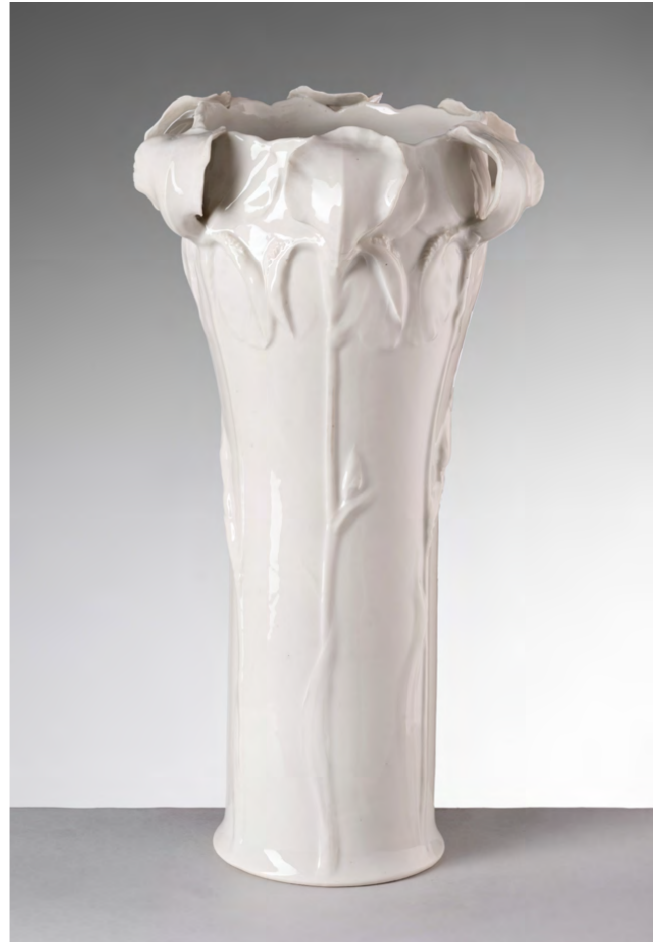
Fig. 7 Società Ceramica Richard-Ginori, Vaso con iris in rilievo, porcellana, 1902 circa, Sesto Fiorentino, Museo Ginori