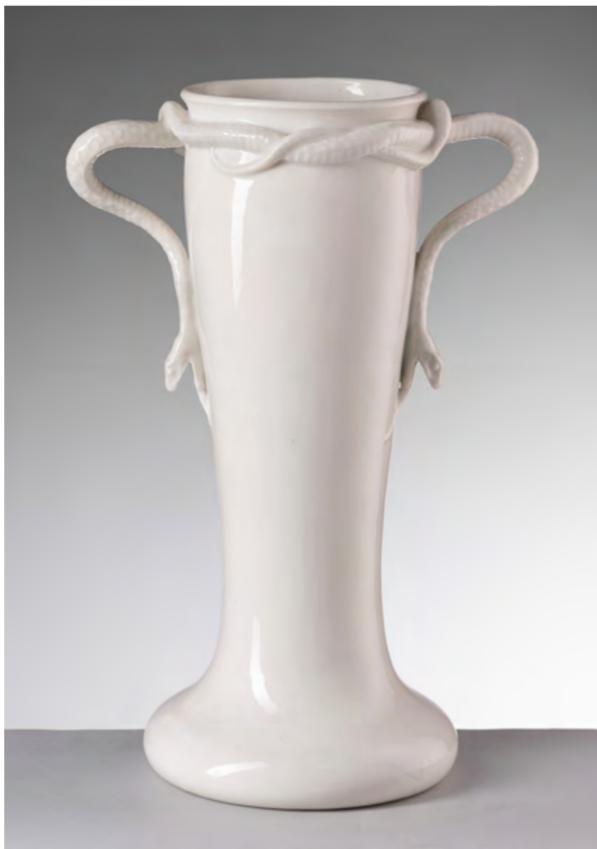
Fig. 4 Società Ceramica Richard-Ginori, Vaso con anse serpentiformi (mod. 112), 1902 circa, porcellana, Sesto Fiorentino, Museo Ginori

aggiornando e alleggerendo un modus operandi che aveva già avuto ampia diffusione in epoca rinascimentale e conseguente ripresa in fase storicista per adattarlo ai nuovi dettami del gusto modernista, ricorrendo a linee più essenziali e sinuose (fig. 4).