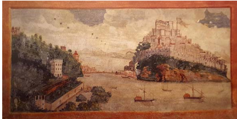
Autore ignoto, XVI secolo Ischia, Torre del Guevara particolare degli affreschi della seconda sala