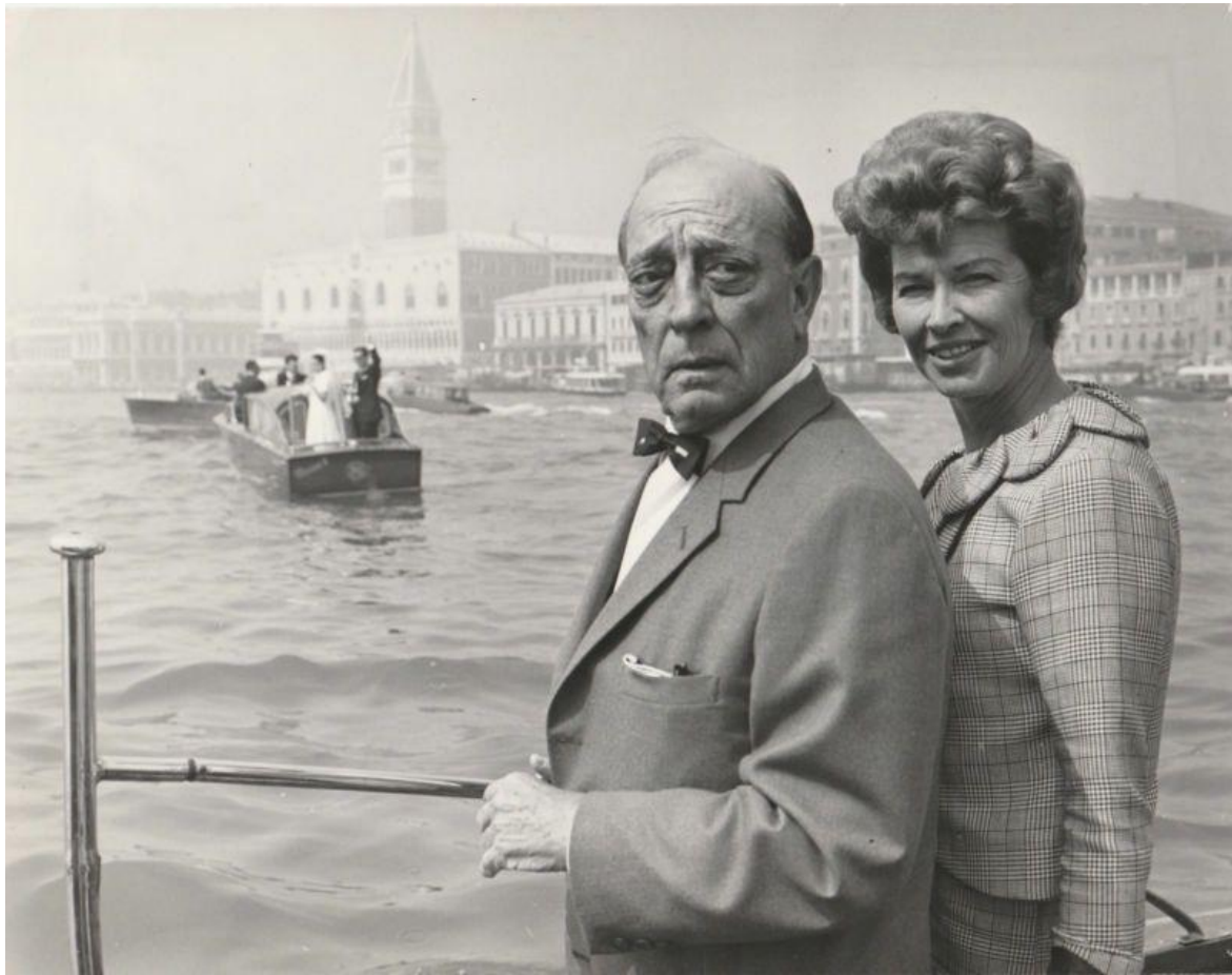
Buster Keaton con la moglie Eleanor alla Mostra del 1965.

Il campo di battaglia esemplare rimane il cinema hollywoodiano, il quale “ha goduto dall’inizio di un doppio atteggiamento: di ammirazione e devozione, per i suoi fenomeni divistici e per alcuni suoi autori, e di presa di distanza causata dal prevalere delle ragioni industriali su quelle artistiche”. Una posizione ostile figlia di un antiamericanismo sorto negli anni Trenta e mantenuto durante il manicheismo proprio della Guerra fredda, ma che ancora riemerge qua e là, come un pregiudizio a serramanico, nonostante la correzione dei flussi politici. A partire dalla grave crisi cinematografica degli anni Ottanta, d'altronde, si presta sempre più attenzione alle produzioni indipendenti, tanto che spesso la vetrina veneziana è offerta a talenti sconosciuti e diviene anticamera per molti trionfi agli Oscar, creando una connessione ideale tra le due manifestazioni che continua tutt'ora.