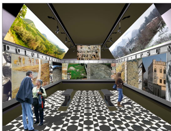
Fig. 8. Lo spazio informativo del percorso di visita aperto in stazione ferroviaria a Montegrotto Terme.

ficativi (fig. 7) lungo un percorso unitario che si snoda per ora nel comune di Montegrotto Terme, ma che auspicabilmente si allargherà a comprendere anche il resto dell'area euganea (fig. 6). Il percorso prende avvio da un punto informativo aperto in una sala della stazione ferroviaria (fig. 8), all'interno del quale si possono reperire depliant e informazioni sulle singole aree archeologiche aperte al pubblico. Queste ultime costituiscono i fulcri di visita del percorso: due di esse (il complesso di via Scavi e le strutture evidenziate sotto l'hotel Terme Neroniane, di cui si è parlato prima) sono state oggetto di restauri e di lavori di allestimento dei percorsi interni di visita e ora sono aperte al pubblico; per una terza (il grande complesso residenziale indagato dall'Università di Padova in via Neroniana) i lavori sono in fase avanzata, in quanto sono già stati completati i restauri delle murature dei vani meglio conservati e realizzate le loro coperture (fig. 9).