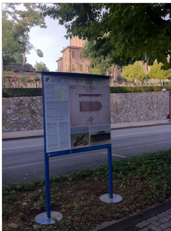
Fig. 7. Uno dei pannelli ubicati a Montegrotto Terme lungo il percorso di visita.

ficativi (fig. 7) lungo un percorso unitario che si snoda per ora nel comune di Montegrotto Terme, ma che auspicabilmente si allargherà a comprendere anche il resto dell'area euganea (fig. 6). Il percorso prende avvio da un punto informativo aperto in una sala della stazione ferroviaria (fig. 8), all'interno del quale si possono reperire depliant e informazioni sulle singole aree archeologiche aperte al pubblico. Queste ultime costituiscono i fulcri di visita del percorso: due di esse (il complesso di via Scavi e le strutture evidenziate sotto l'hotel Terme Neroniane, di cui si è parlato prima) sono state oggetto di restauri e di lavori di allestimento dei percorsi interni di visita e ora sono aperte al pubblico; per una terza (il grande complesso residenziale indagato dall'Università di Padova in via Neroniana) i lavori sono in fase avanzata, in quanto sono già stati completati i restauri delle murature dei vani meglio conservati e realizzate le loro coperture (fig. 9).