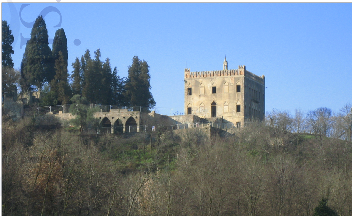
Fig. 10. Villa Draghi a Montegrotto Terme, sede del futuro Museo del Termalismo.

pulsante di un parco che nell'intenzione dei promotori potrà progressivamente espandersi, collegandosi non solo al Parco dei Colli Euganei (quasi 20.000 ha), istituito con legge regionale del 1989 e comprensivo di 15 comuni, ma anche ad altri importanti nuclei storico-archeologici presenti nel comprensorio (includendo quindi nella »rete« altri contesti).