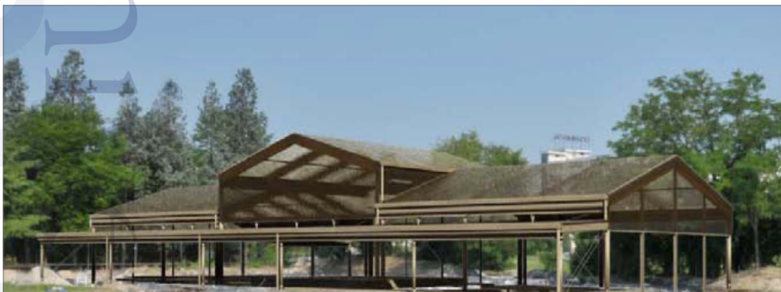
Fig. 9. La copertura del settore residenziale della villa di via Neroniana a Montegrotto Terme.