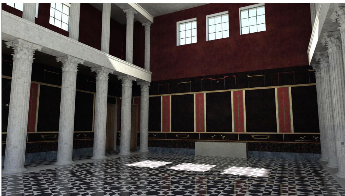
Fig. 5. La ricostruzione del vano di rappresentanza della villa (ricostruzione grafica E. Brener).

Tutta questa lunga fase di analisi dei contesti archeologici euganei in chiave, come si è detto, sincronica e diacronica, i cui risultati sono stati ampiamente comunicati tramite giornate di studio e convegni, ultimamente organizzati a cadenza annuale, 38 ha permesso di evidenziare e studiare approfonditamente gli elementi che sono stati poi oggetto di valorizzazione.