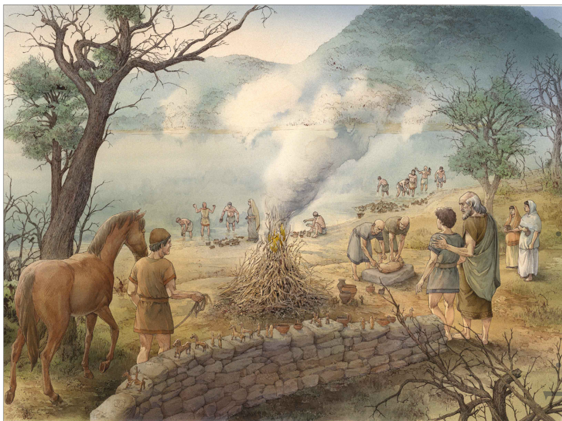
Fig. 2. Il santuario protostorico individuato a Montegrotto Terme in prossimità di un laghetto / polla di acqua termale oggi inattivo in una ricostruzione della ditta Ink Link.

L'utilizzo di tali acque medicamentose e dei fanghi, dotati in particolare di proprietà antinfiammatorie, ha origini molto antiche, come confermano ampiamente i dati archeologici. In effetti, già a partire dall'VIII–VII sec. a.C., nel territorio dell'odierno Montegrotto Terme era attivo un santuario organizzato attorno a un bacino d'acqua termale, di notevole importanza anche per il ruolo di frontiera giocato fra il territorio patavino e quello atestino (fig. 2). 15 Gli scavi hanno restituito migliaia di vasetti pot-