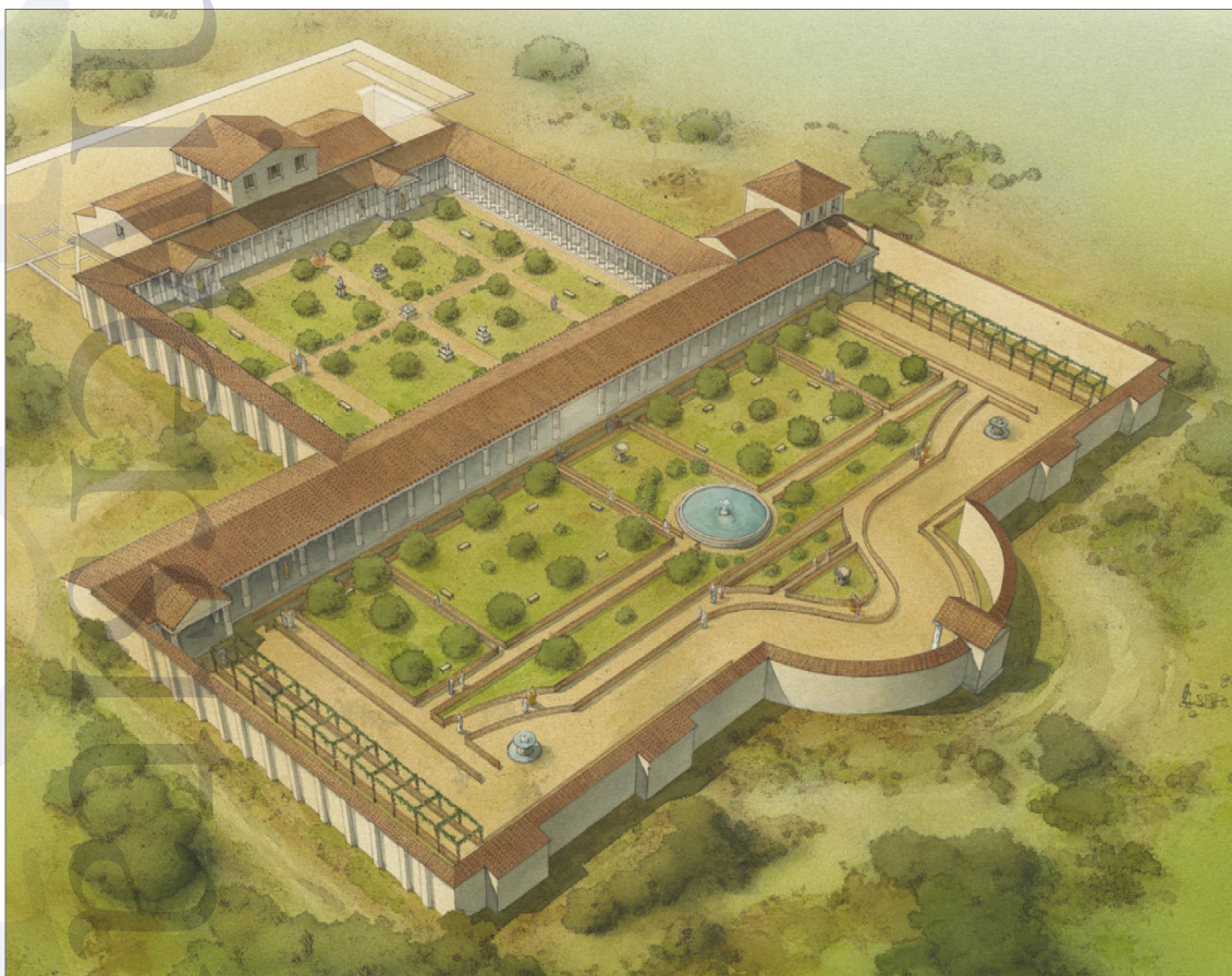
Fig. 4. La villa portata alla luce dalle indagini dell'Università di Padova in via Neroniana a Montegrotto Terme in una ricostruzione della ditta Ink Link.

li (m 55 x 15 ca.), la cui esistenza sembra confermata anche da notizie settecentesche. 36